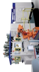
MILL-TURN MULTI-SPINDLE MACHINES