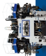
FLEXIBLE TRANSFER MACHINES