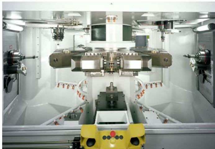
Transfermaschine ab Stange mit Zangen und Spannfuttern TRANS-BAR-COLLET

4-5 Achsen flexible Transfermaschine mit kontinuierlichen Indexierungsspannfuttern und Elektroschindel Module Bearbeitungszentren mit Werkzeugwechsel TRANS-N-CENTER MAXI